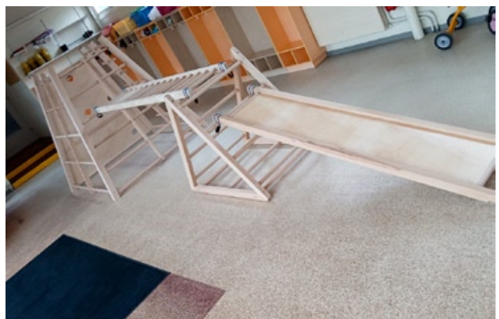
Structure de motricité à l'école maternelle