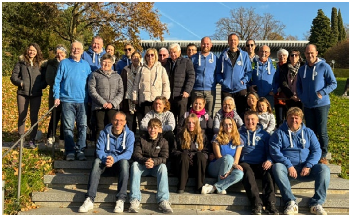
Sur les marches menant au musée olympique