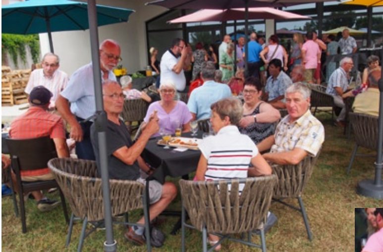
24 août - Retrouvailles chaleureuses lors de l'apéritif de bienvenue ...