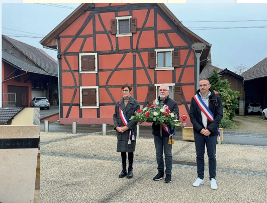
Traditionnel dépôt de gerbe au mur du souvenir, le 11 novembre, en hommage aux morts de toutes les guerres.