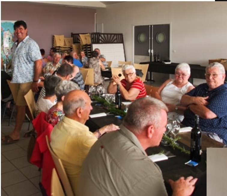
... et du repas offerts par la commune de Benquet.